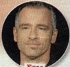
Eros Ramazzotti, 49

Roma. Soddisfazioni lavorative per Emma Marrone (28 anni, a lato) direttore artistico dei Blu al serale di Amici 12 . La cantante salentina si dichiara single ma, secondo la nota medium Elisa (sopra), la quale ha accettato per Top una piccola indagine sulle coppie vip, avrebbe una relazione amorosa che, ad oggi, preferirebbe tenere ben nascosta.