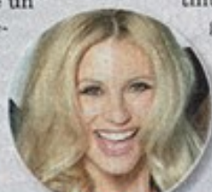
Michelle Hunziker, 36

del sole. Teme, infatti, di poter ripetere in qualche modo degli errori già commessi in passato. Dopo un'amicizia speciale, l'amore tra loro sta nascendo, anche se per il momento continuano a vedersi di nascosto. Lui non è un volto noto del mondo dello spettacolo, non è